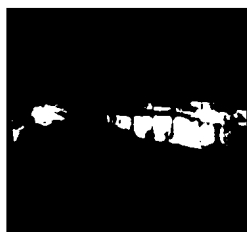
La boca del museo CORPUS.

Pensado para alentar una vida sana, ocho años es la edad ideal para adentrarse en esta aventura corporal. En ese momento, los niños empiezan a vislumbrar que la asignatura de ciencias naturales forma parte de su vida cotidiana, y pueden absorber las ventajas del respeto por el entorno. Que el objetivo tiene visos de cumplirse, y en un ambiente lúdico, lo demuestran los comentarios de los más pequeños nada más introducirse en el gigante sedente por su rodilla. "Mamá, mira, estamos en la pierna del señor muñeco", decía una niña mientras subía por una escalera mecánica para contemplar, de inmediato, la reacción de la piel ante la agresión de una astilla clavada en la misma.